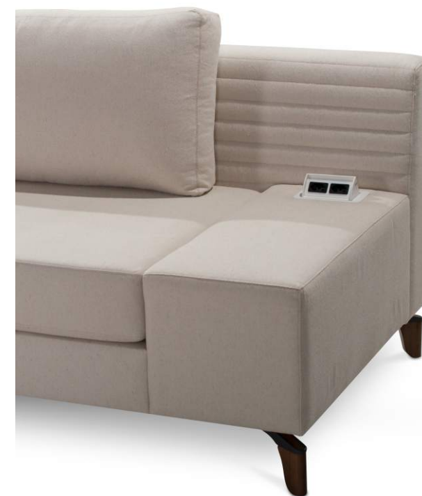
Opcional: caixa de tomadas aplicada ao braço de 330mm